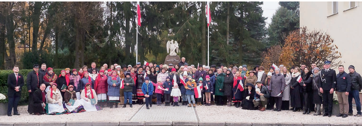
Fot. Małgorzata Sulisz (4)