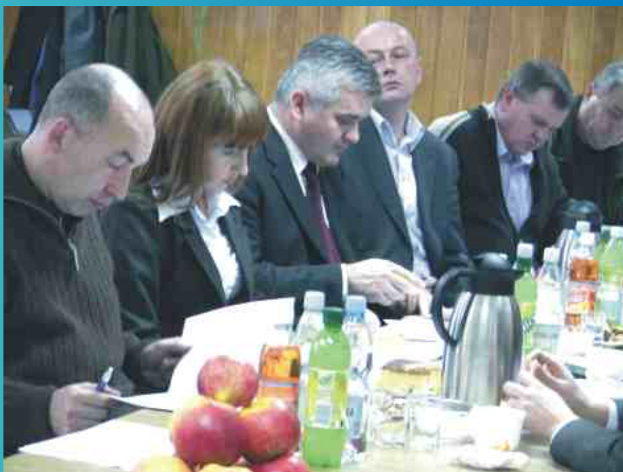
Obrady Lokalnej Grupy Działania „Kraina Wokół Lublina” podczas sesji w Urzędzie Gminy Konopnica

LGD wspiera lokalne instytucje publiczne i prywatne w gminach wokół Lublina. Ze środków przyznanych na realizację celów LSR w ramach programu Leader będzie dofinansowywać następujące przedsięwzięcia mające na celu: wsparcie firm w rejonie zrzeszonych gmin, poprawę oferty spędzania wolnego czasu, rozbudowę bazy sportowej i organizację imprez sportowo-rekreacyjnych, popularyzację regionu poprzez budowę szlaków turystycznych oraz promocję tradycyjnej sztuki kulinarnej etc.