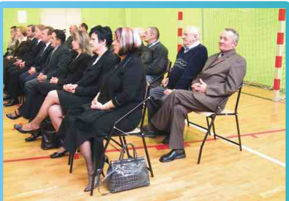
Dyrektorzy szkół, radni, sołtysi naszej gminy w trakcie koncertu orkiestry

Korzystając z zaproszenia Rady Gminy dyrektorzy przedstawili szczegółową analizę wyników nauczania w odniesieniu do średnich wyników powiatu i województwa.