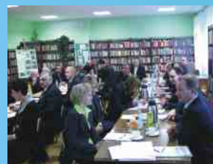
Wyjazdowa sesja Rady Gminy Szkoła Podstawowa w Motyczu

Na ręce zarówno dyrektorów jak i nauczycieli składamy gratulacje za ww osiągnięcia!