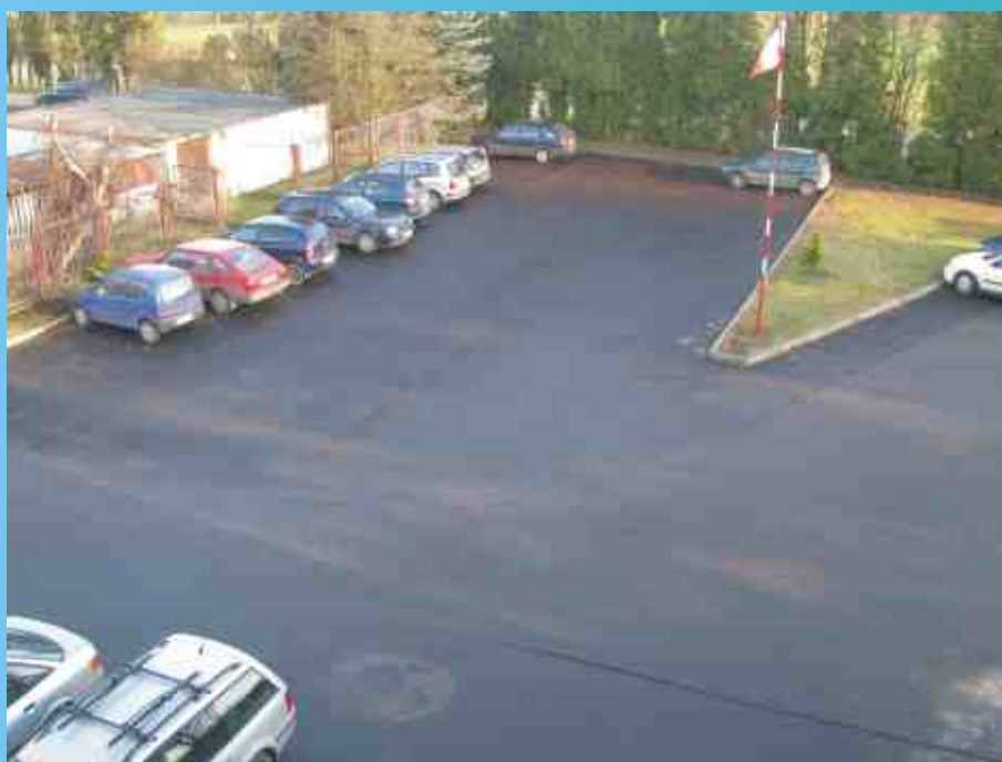
Wyremontowany budynek Urzędu Gminy Konopnica wraz z nowym parkingiem