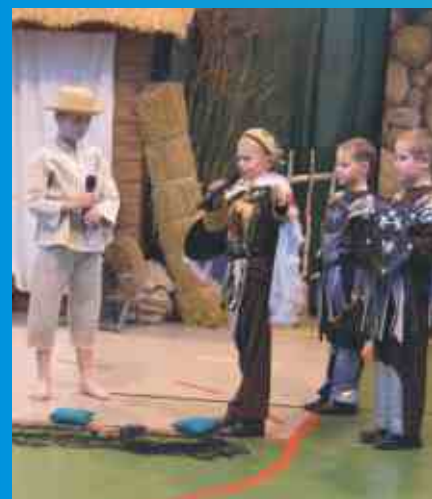
Wszystkim zaangażowanym w nadanie imienia szkole oraz w zorganizowanie tak wspaniałej uroczystości - gratulujemy!