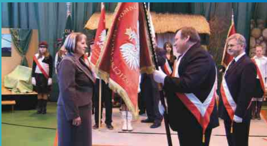
Przekazanie sztandaru przez Przewodniczącego Rady Gminy na ręce dyrektor szkoły

Należy zaznaczyć, że przebieg uroczystości został profesjonalnie przygotowany i przebiegał w bardzo miłej atmosferze.